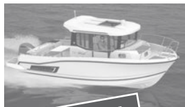
Merry Fisher 795 marlin