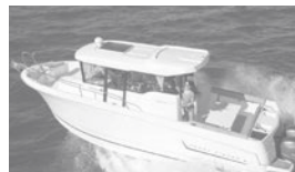
Merry Fisher 855 marlin