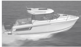
Merry Fisher 695