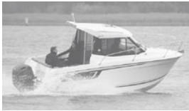
Merry Fisher 605