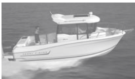
Merry Fisher 695 marlin